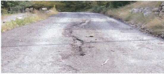
Montée de Barés

La route de l'aérodrome (chemin de Barés) a été fortement endommagée et rendue dangereuse pour les usagers. L'entreprise EUROVIA, qui avait effectué la première tranche de travaux, a procédé à sa réfection et a pris à sa charge son coût. La deuxième tranche aura lieu au printemps.