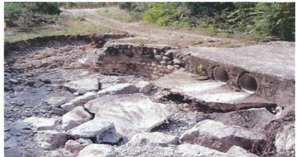
Pont de Rataloup