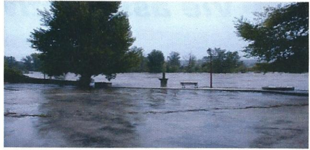
Place de la Molle

Inondations, épisodes pluvieux de forte intensité en septembre et octobre ont entraîné certains dégâts sur la commune. Lanas a été reconnue en état de catastrophe naturelle par la Préfecture. Les démarches de demande d'indemnisation ont été faites auprès des différentes administrations .