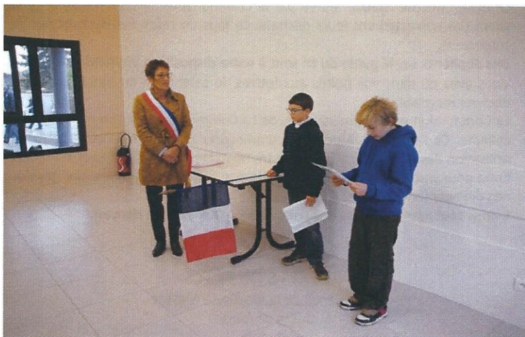
Ces deux poèmes ont été récités par deux élèves scolarisés à Saint-Maurice .