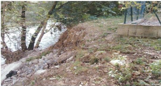
Poste de relevage

Au niveau du poste de relevage, la présence d'un gros peuplier favorisait le creusement au pied de ce poste. Il a été abattu ainsi que cinq autres. Des travaux d'enrochement sont nécessaires. Devis et demande de financement ont été effectués.